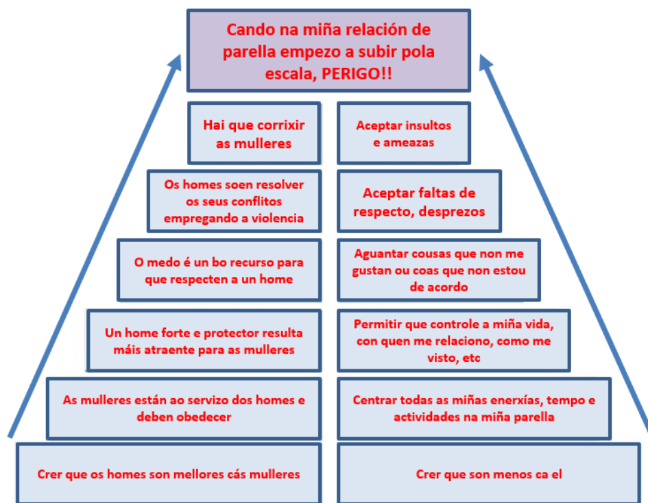
A ESCALA DA VIOLENCIA DE XÉNERO