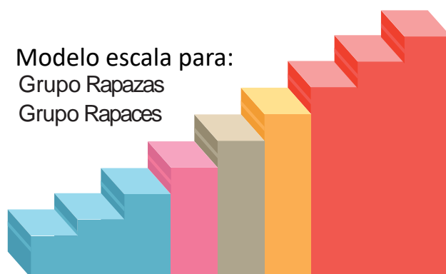
Modelo escala para: Grupo Rapazas Grupo Rapaces

Cando rematemos o debate levaremos a cabo unha "escala de violencia" con todo o grupo-clase. Para iso usaremos o cartón e trazaremos unha escala con tantos pasos como distintas situacións se expuxeron. Despois escribiremos cada unha destas situacións en cada chanzo desa escala, colocándoa na posición que o grupo considere conveniente.